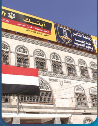
كلية الهندسة وعلوم الحاسوب