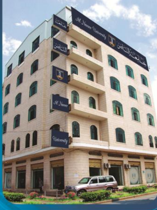
كلية العلوم الطبية